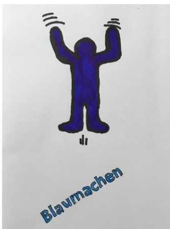
Übertragen auf Folie