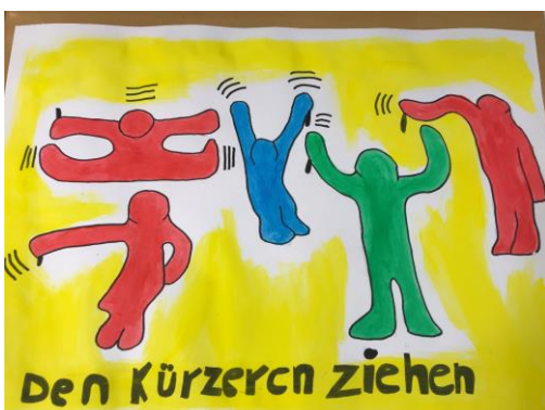
Ausmalen auf Postergröße