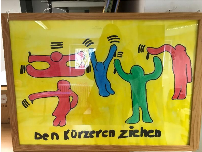
Rahmen des fertigen Bildes