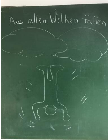
Probepbilder an der Tafel